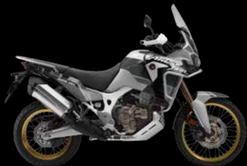
AFRICA TWIN ADVENTURE SPORTS