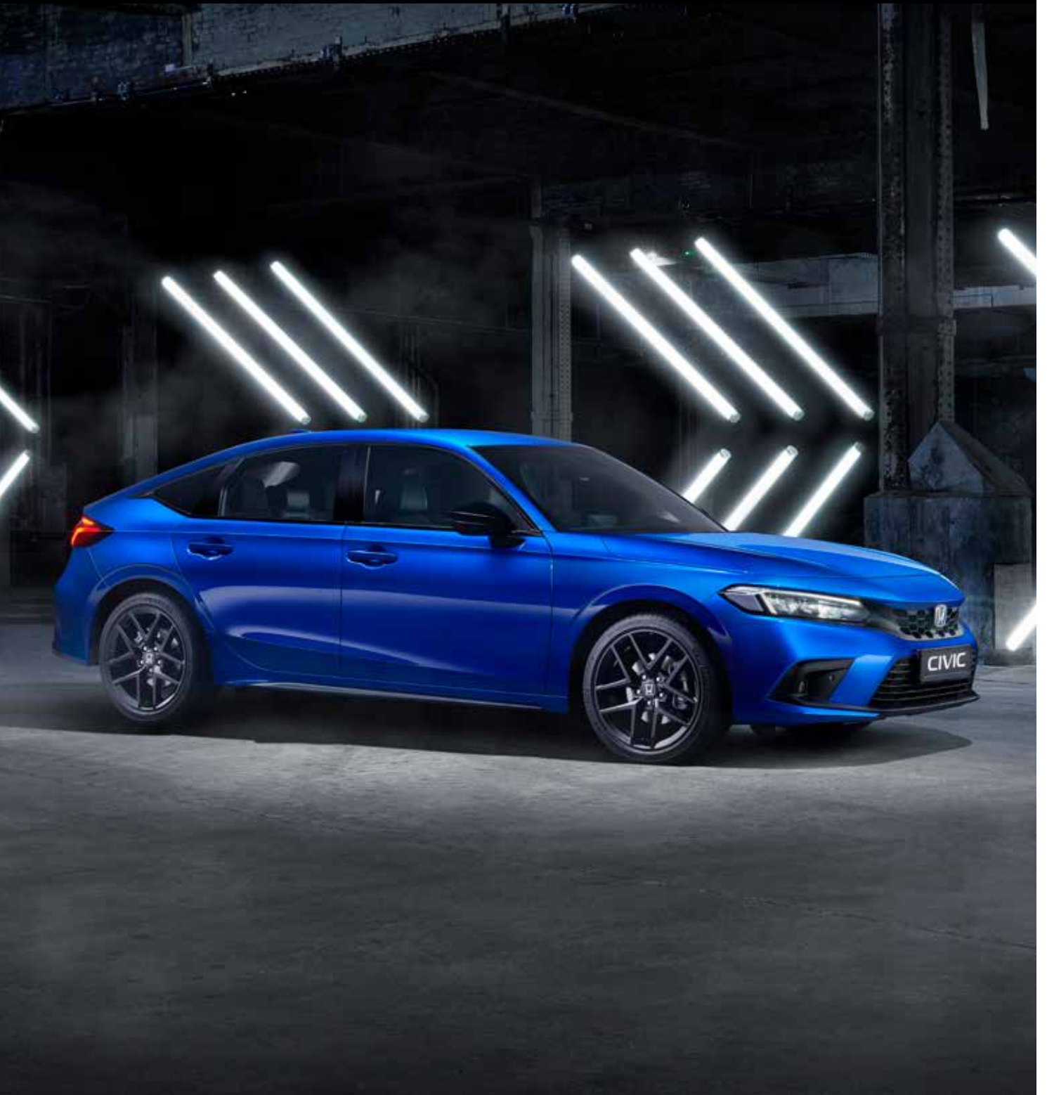
De nieuwe Honda Civic e:HEV