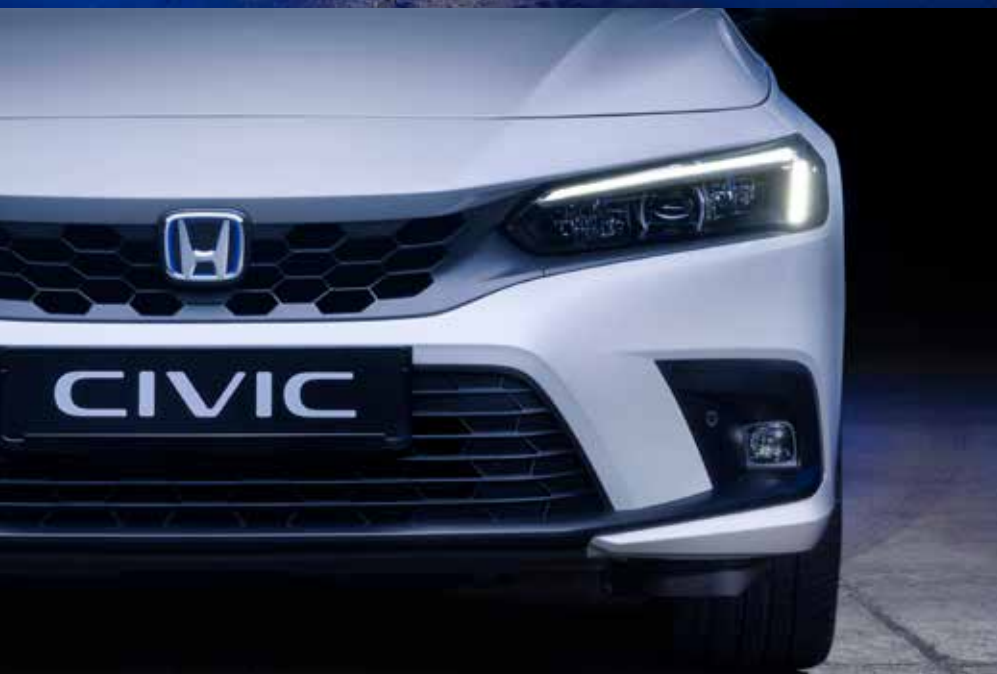
De nieuwe Honda Civic e:HEV