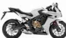
Pearl Metalloid White