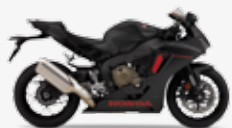
Matt Ballistic Black Metallic