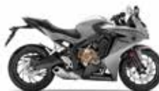
Sword Silver Metallic