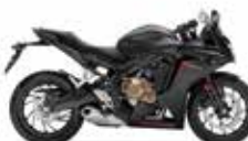
Matt Gunpowder Black Metallic