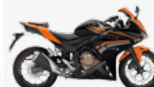
Graphite Black Candy Energy Orange