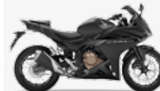
Matt Gunpowder Black Metallic