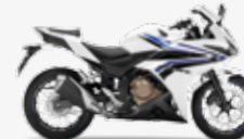
Pearl Metalloid White