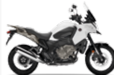
Pearl Glare White