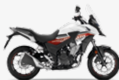
Pearl Horizon White