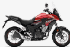
Candy Rosy Red