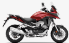
Candy Prominence Red