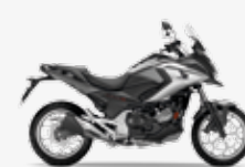
Sword Silver Metallic