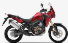
Candy Prominence Red