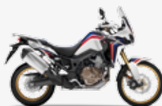
Pearl Glare White Tricolour