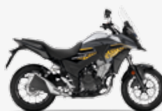
Sword Silver Metallic