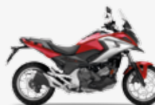
Candy Prominence Red