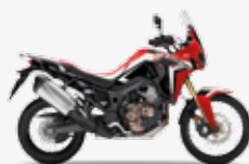
Victory Red (CRF Rally Red)