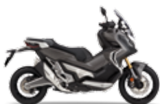
Matt Bullet Silver