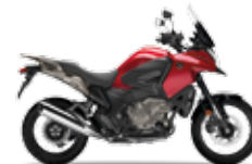
Candy Prominence Red