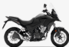
Matt Gunpowder Black Metallic