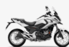
Matt Pearl Glare White