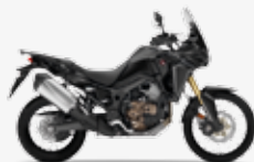
Matt Ballistic Black Metallic