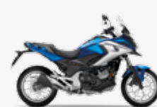
Glint Wave Blue Metallic