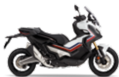
Pearl Glare White