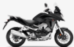
Matt Ballistic Black Metallic