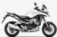
Pearl Glare White