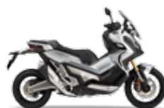
Digital Silver Metallic