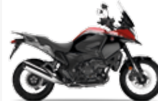
Candy Prominence Red Graphite Black