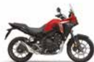
Nieuwe kleur 2024 Grand Prix Red