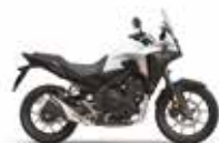
Nieuwe kleur 2024 Pearl Horizon White