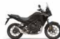
Nieuwe kleur 2024 Mat Gunpowder Black Metallic