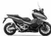
Nieuwe kleur 2024 Mat Iridium Gray Metallic