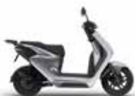
Digital Silver Metallic