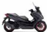
Special Edition Mat Cynos Gray Metallic