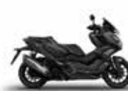
Nieuwe kleur 2024 Mat Coal Black Metallic