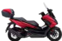
Nieuwe kleur 2024 Pearl Siena Red