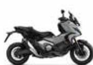
Nieuwe kleur 2024 Puco Blue