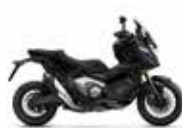
Mat Balistic Black Metallic