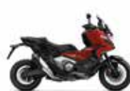
Nieuwe kleur 2024 Grand Prix Red