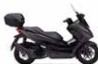
Mat Cynos Gray Metallic