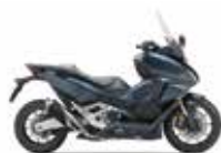
Mat Jeans Blue Metallic