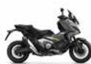
Nieuwe kleur 2024 Iridium Gray Metallic