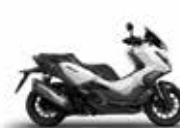
Nieuwe kleur 2024 Mat Pearl Cool White