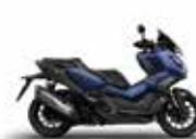
Nieuwe kleur 2024 Mat Pearl Pacific Blue