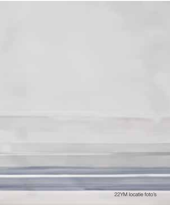
22YM locatie foto's