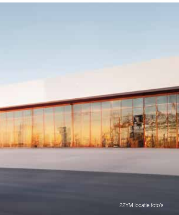
22YM locatie foto's