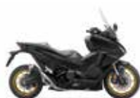
Nieuwe kleur 2024 Mat Ballistic Black Metallic