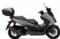
Pearl Falcon Gray