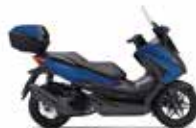
Mat Pearl Pacific Blue