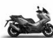
Nieuwe kleur 2024 Pearl Falcon Gray