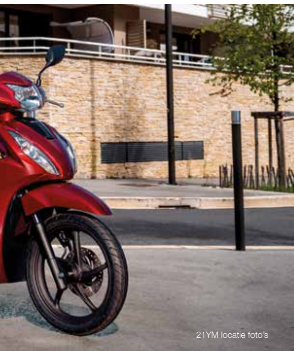
21YM locatie foto's