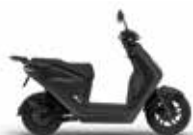
Mat Ballistic Black Metallic