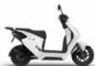
Pearl Sunbeam White