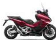
Nieuwe kleur 2024 Candy Chromosphere Red